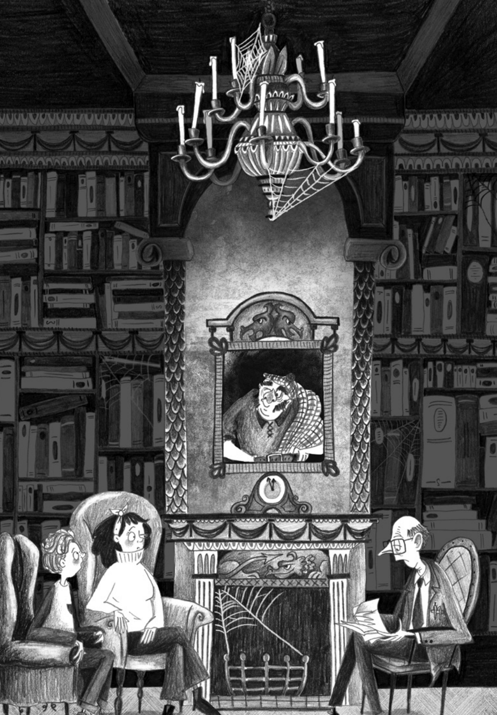
David O'Connell: Karkkitehtaan kummitus Näytesivut kirjasta © Kumma-kustannus & tekijä