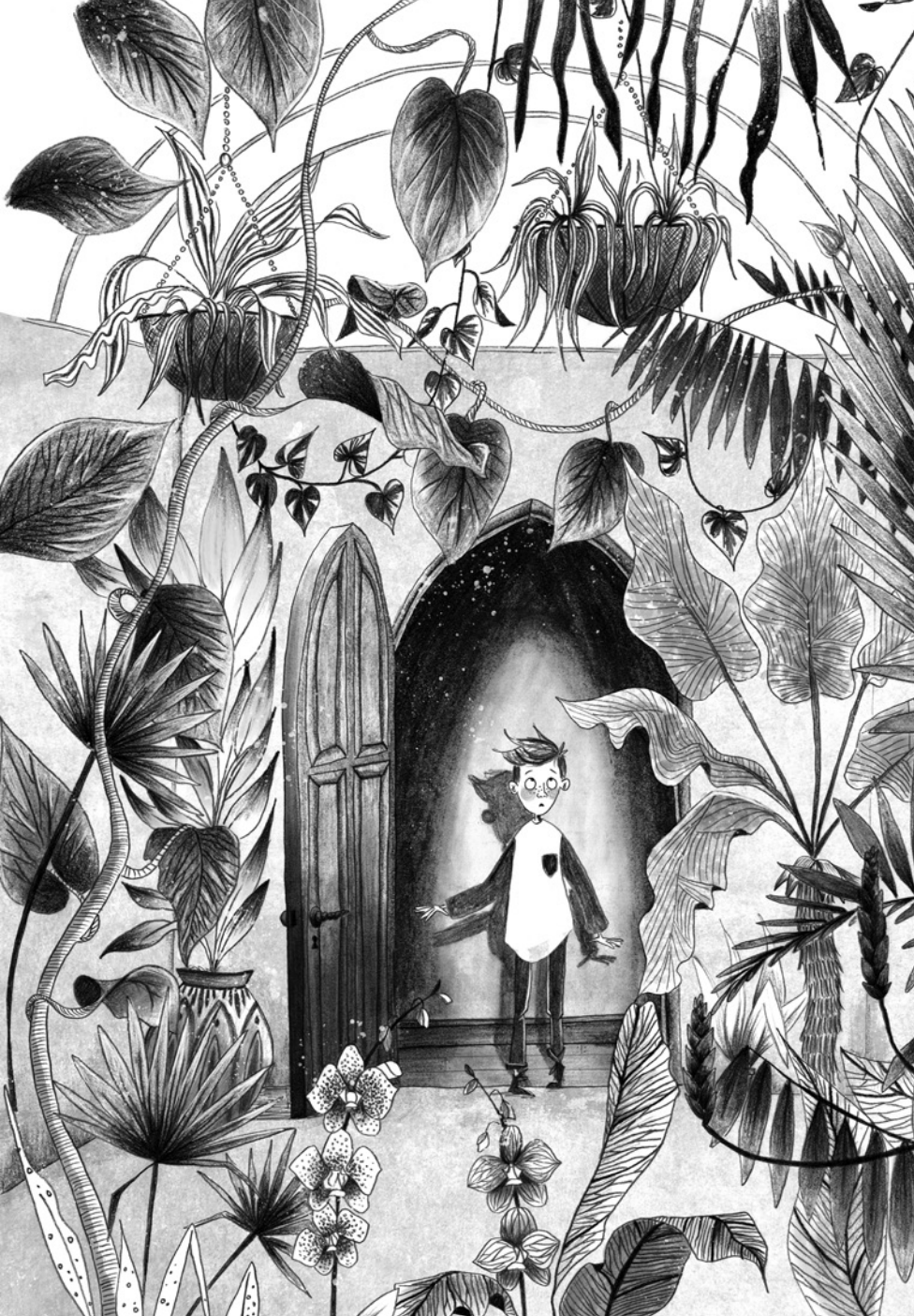
David O'Connell: Karkkitehtaan kummitus Näytesivut kirjasta © Kumma-kustannus & tekijä